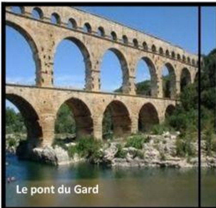
Le pont du Gard