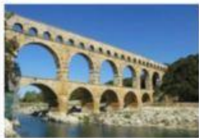
Port du Nord