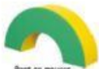
Pont en mezzos