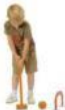
Arche de jeu de croquet